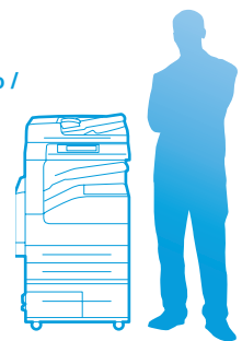
WorkCentre 5335 con bandeja tándem de alta capacidad

Ancho x Prof x Alto: 597 x 637.5 x 1,115 mm 23.5 x 25.1 x 43.9 pulg